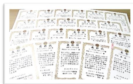
2022-2023 地区ガバナーズアワード 20部門に賞をいただきました